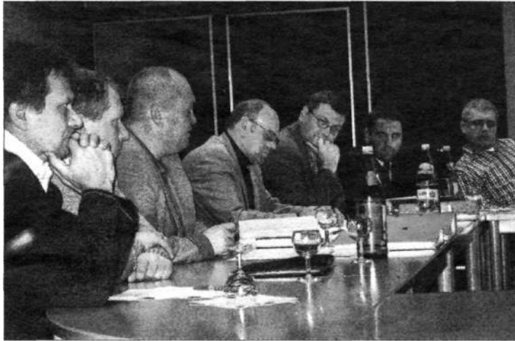
Die gesamte ÖVP-Fraktion ist sich einig: „Der Zustand ist untragbar für Pernitz und schadet der Gemeinde.“