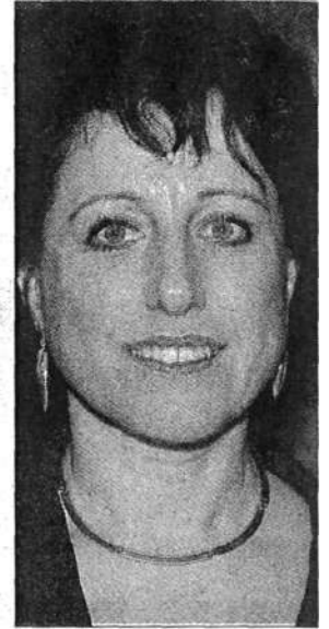
Bürgermeisterin Silvia Rupprecht: „Ich bin stark genug, weil ich eine Frau bin.“