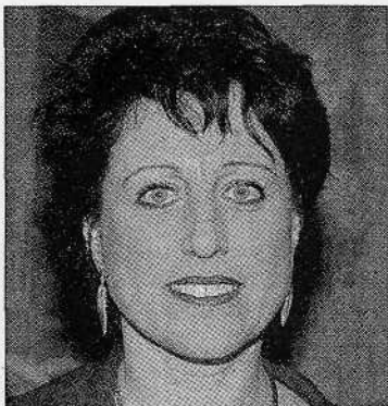
Bürgermeisterin Silvia Rupprecht kandidiert mit eigener Liste...