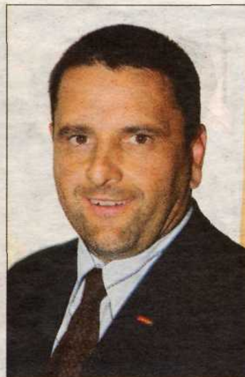
...ÖVP-Fraktionsobmann Erich Panzenböck und...